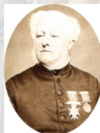
Dr. William Penny Brookes