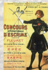
Plakát olympijských her 1900 v Paříži.

V Olympii, nacházející se na Peloponézském poloostrově, se konaly už před 2500 lety olympijské hry. Ty první se uskutečnily v roce 776 př.n.l. a za jejich zakladatele je považován Herakles, syn Dia a Alkmény. Ten měl být hned po svém narození zabít dvěma hady, které mu poslala Héra, Diova žárlivá manželka. V následující době se Héri podařilo přinést svého nevlastního syna k takovému šílenství, že dokonce zabil své vlastní děti. Za trest měl nastoupit do služby ke králi Eurystheovi, který mu zadal dvanáct úkolů. A tak měl Herakles zvítězit nad nezranitelným nemejským lvem a nad devítihlavou Hydroú, která požírala lidi. Rovněž během jednoho dne vyčistil obrovský Augiášův chlév tím, že svedl do chléva dvě řeky. Pak se dostal s králem do sporu, který Augiáš nepřežil. Nakonec měl Herakles založit olympijské hry. Ty byly určeny všem Řekům. Závodníkům divákům byla zaručena ochrana a bezpečnost v době příjezdu i odjezdu, stejně jako po celou dobu trvání her. Vrcholu dosáhly hry v 5. a 4. stol. př.n.l. V roce 393 n.l. byly zakázány římským císařem Theodosiem I. jako pohanství kult.