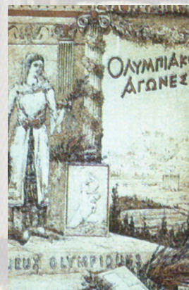
Plakát prvních novodobých olympijských her 1896 v Athénách.