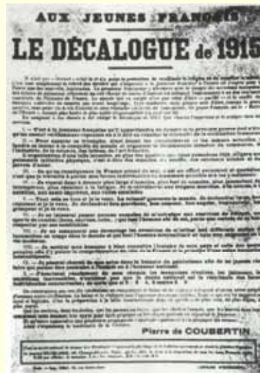
Coubertin, «Le décalogue de 1915 » adressé aux jeunes Français.