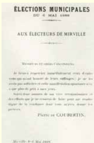
Aux électeurs de Mirville, mai 1888

En 1925, il a fondé l'Union Pédagogique Universelle dont les résultats - rédigés en quatre langues - ont eu un retentissement international de par leur originalité et leur réalisme.