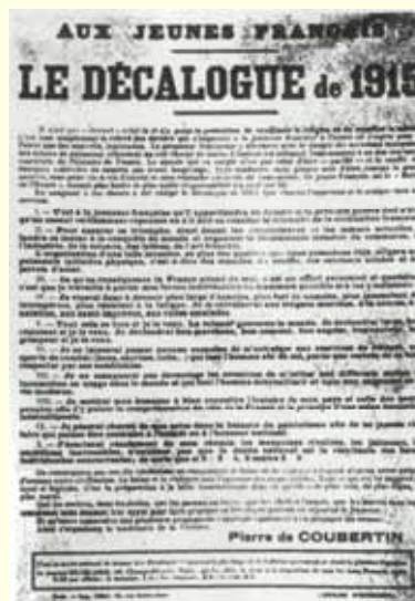
Coubertin „Die zehn Gebote der Jugend von 1915“