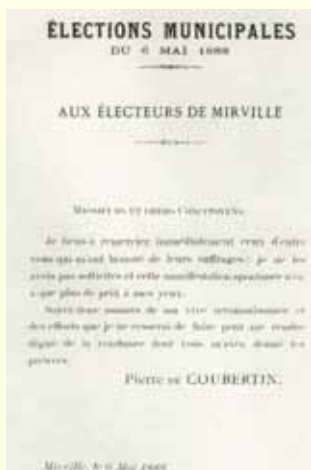
Die Kommunalwahlen am 6. Mai 1888 für die Bürger von Mirville

1925 gründet er die Universale Pädagogische Union, deren Ergebnisse- in vier Sprachen verfasst- durch Originalität und Realismus für internationales Aufsehen sorgen werden.