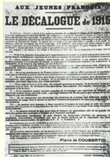
Coubertin, « I dieci comandamenti » della gioventù.