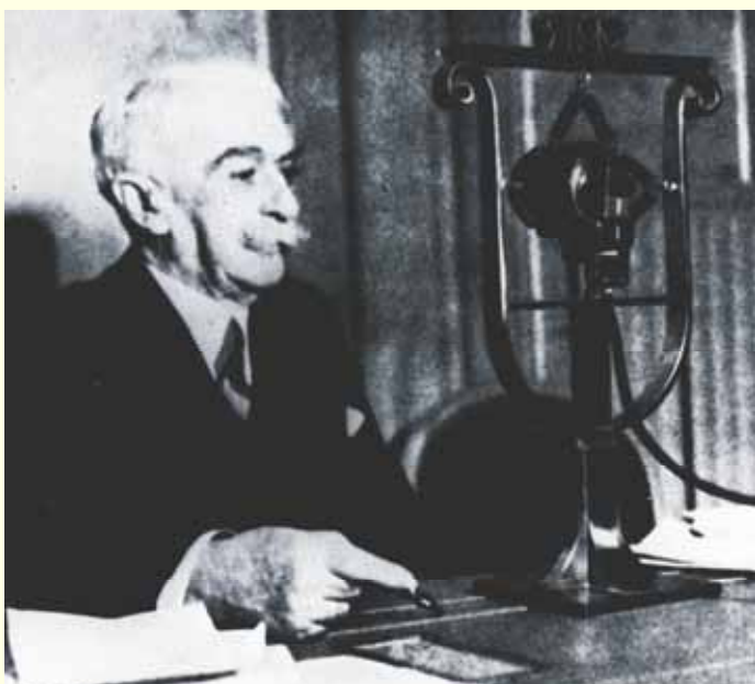
Pierre de Coubertin durante a transmissão de rádio dum discurso dirigido à juventude americana, em 1934.

Em 1890, Coubertin solicitou uma reforma radical do sistema escolar francês.