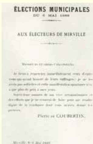
Aos eleitores de Mirville, em Maio de 1888

em 1925, fundou a União Pedagógica Universal, cujos resultados - redigidos em quatro línguas - tiveram uma repercussão internacional pela sua originalidade e pelo seu realismo.